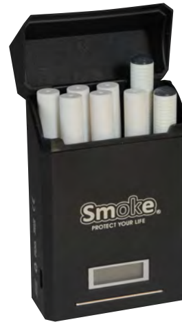
Cargador Portatil (Cejetilla)

El Cigarro Electrónico "Smoke" se compone de: