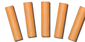
5 boquillas sin nicotina