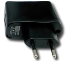
Transformador Multivoltaje 100-240 Volts